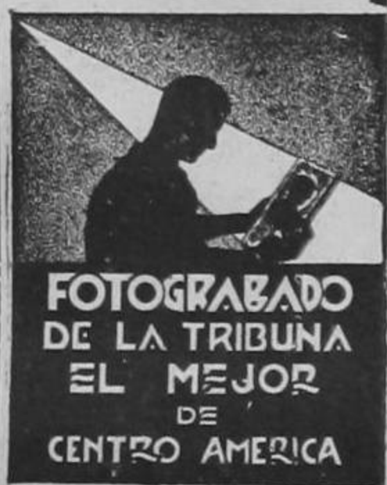
FOTOGRAFADO DE LA TRIBUNA EL MEJOR DE CENTRO AMERICA